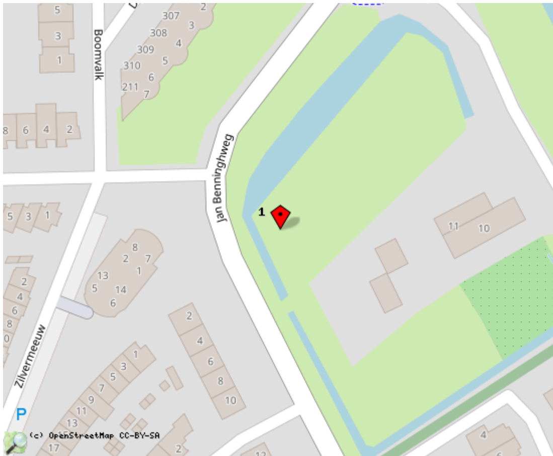
Locaties in de kaart