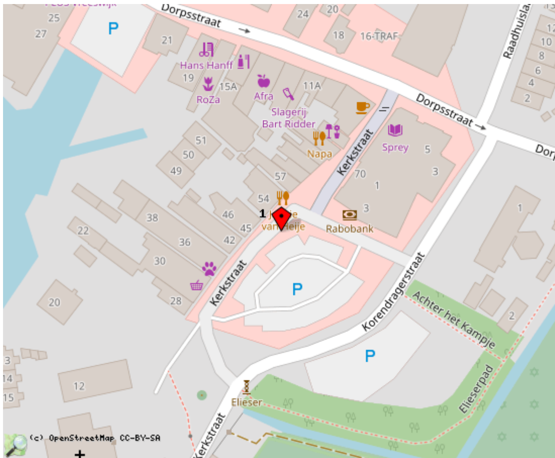
Locaties in de kaart