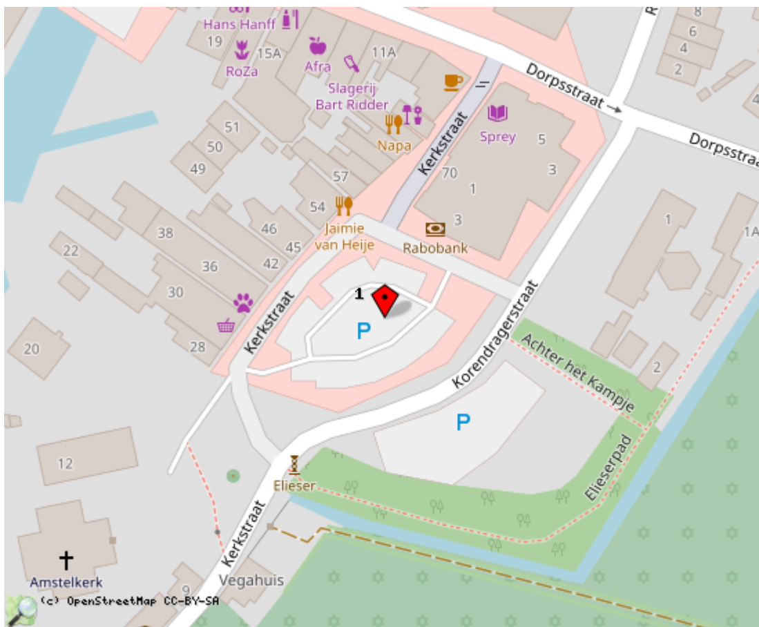
Locaties in de kaart