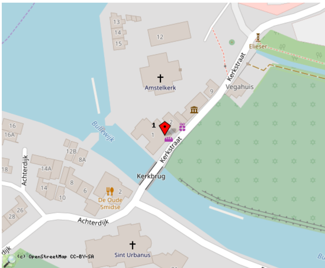
Locaties in de kaart