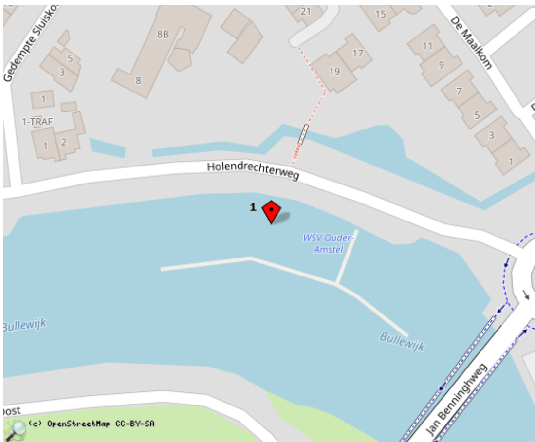
Locaties in de kaart