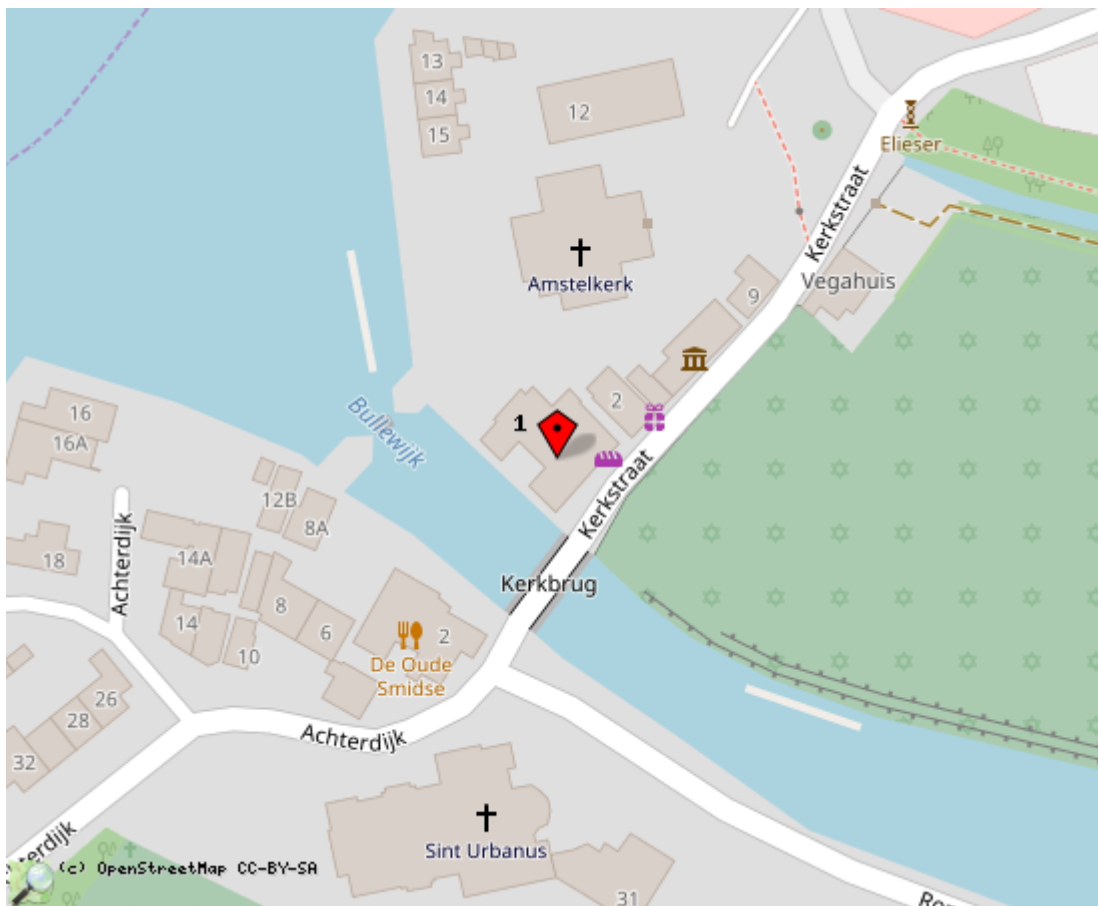
Locaties in de kaart