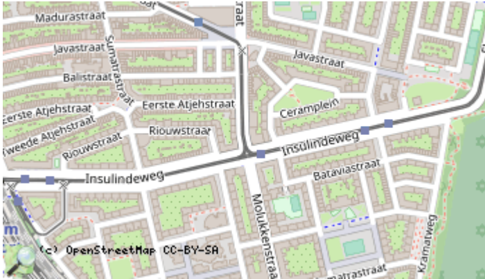
Locaties in de kaart