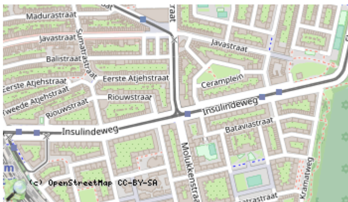
Locaties in de kaart