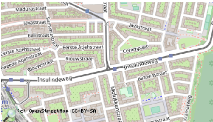
Locaties in de kaart