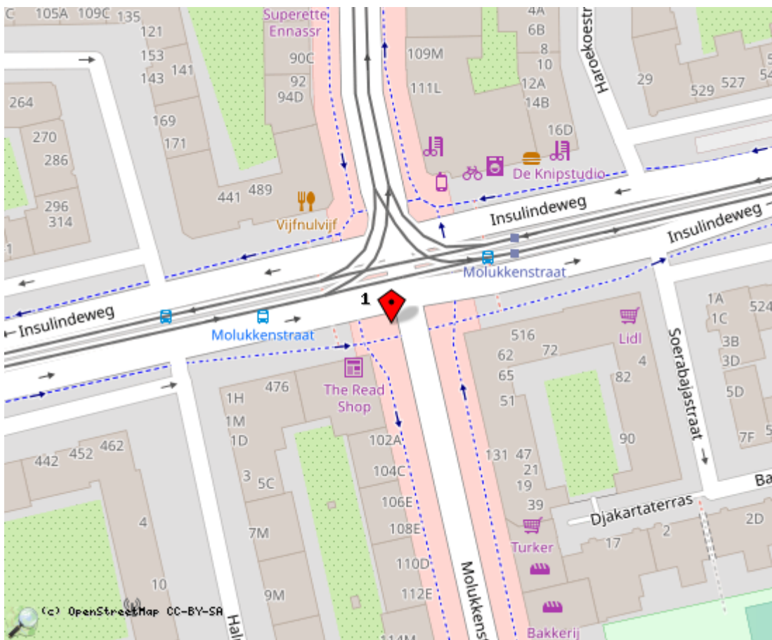
Locaties in de kaart