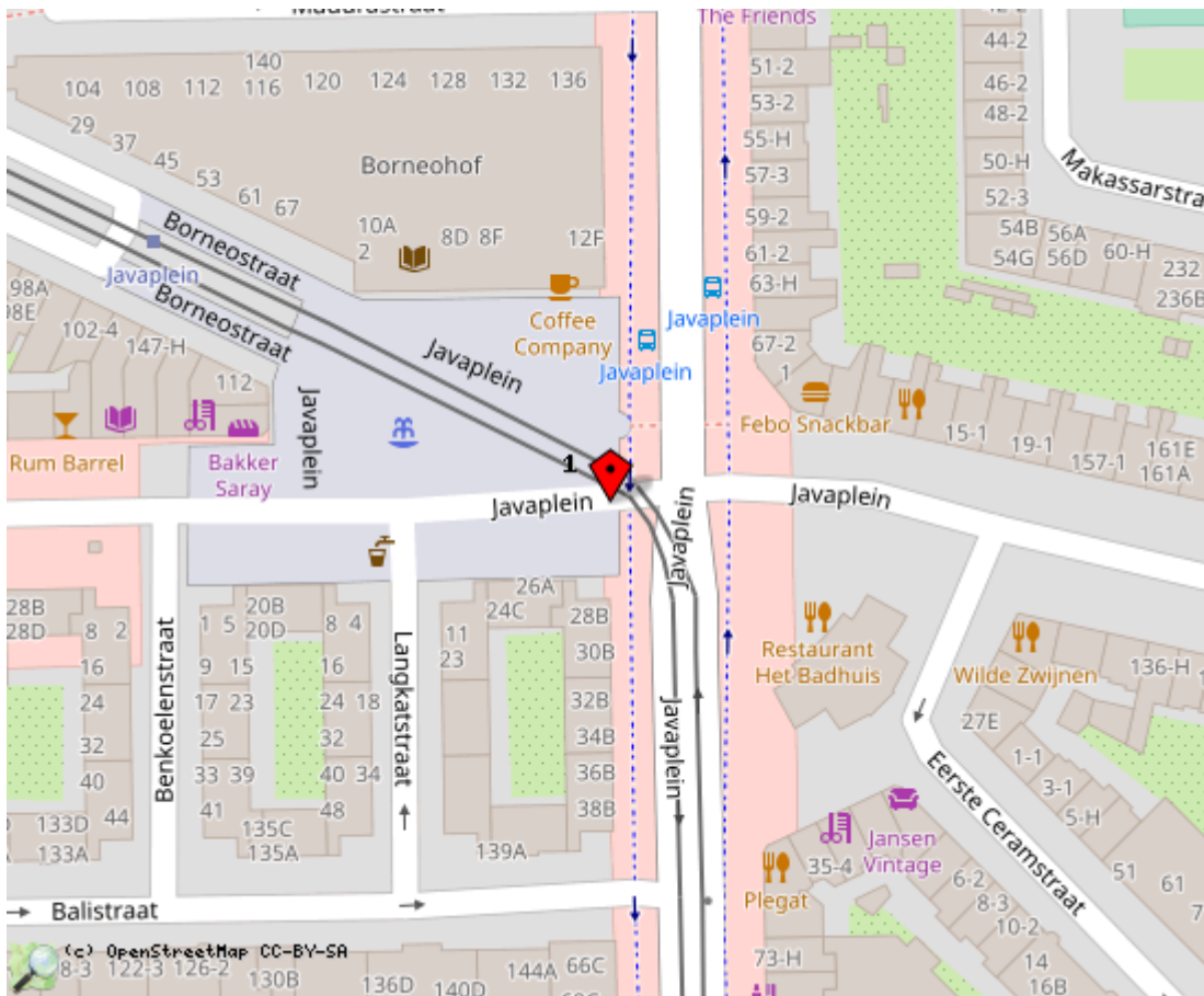
Locaties in de kaart